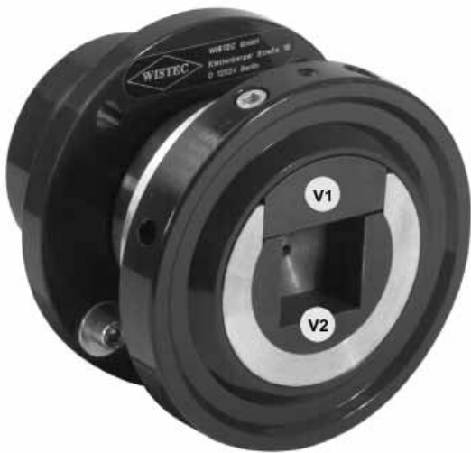
WISTEC Sicherheitslager als Flanschlager

...für eine optimale Drehmomentübertragung von der Maschine zur Wickelwelle. Wir bieten modernste schiebend schließende Lager mit standardisierten Verschleißteilen (V1, V2) an.