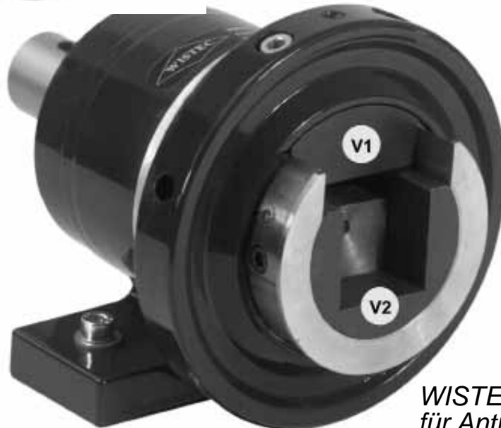
WISTEC Stehlager, hier mit Zapfen, für Antrieb oder Bremse