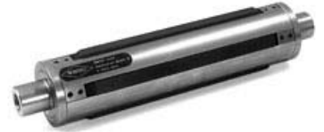
Wellentyp „L“ mit Spann-Leisten