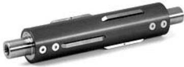
Wellentyp „K“ mit Spann-Keilen