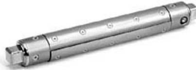
Wellentyp „S“ mit Spann-Schalen